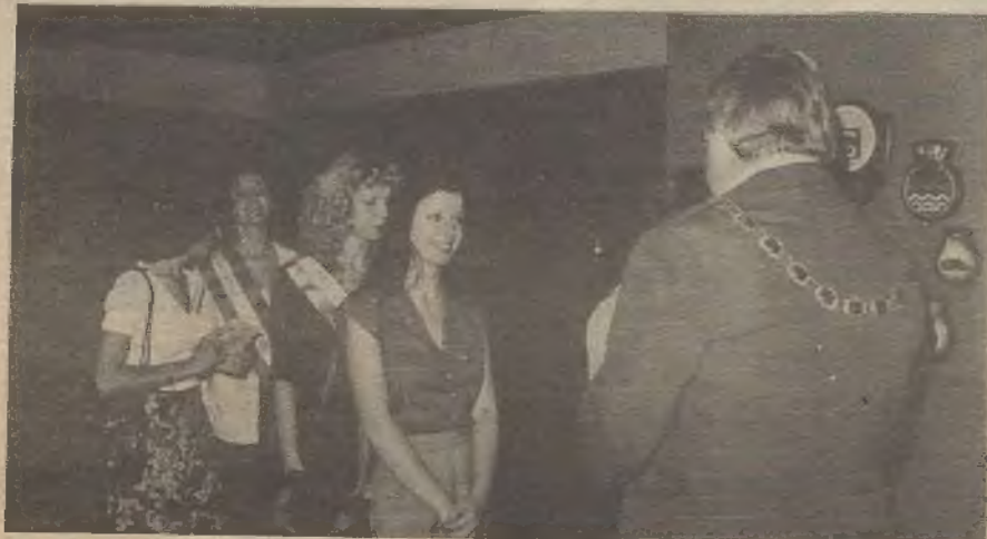
Medju brojnim gostima, uzvanicama na priredjenom banketu u gradskoj vijećnici grada Fremantle našle su se i naše mlade Miss Croatije.

Krenuli smo sa igrališta u jednom autobusu (drugi pojedinci u svojim automobilima) i svi zajedno smo se sakupili izpred zgrade Gradske Vijećnice grada Fremantle smještene na uglu William Street i Adelaide Street a na pročelju MALL-a. Town Hall, jedna vrlo impozantna i moderna zgrada jest sjedište administrativne vlasti grada Fremantle. Ovaj grad je žila kucavica ne samo Perth, već i jednog dobrog djela Zapadne Australije, jer kroz njenu luku i prilaze, ulaze i izlaze brojni brodovi odvozeći rude i bogatstva Zapadne Australije a uvozeći sve potrebne artikle za gradjane Perth, Fremantla i ostale unutrašnjice.